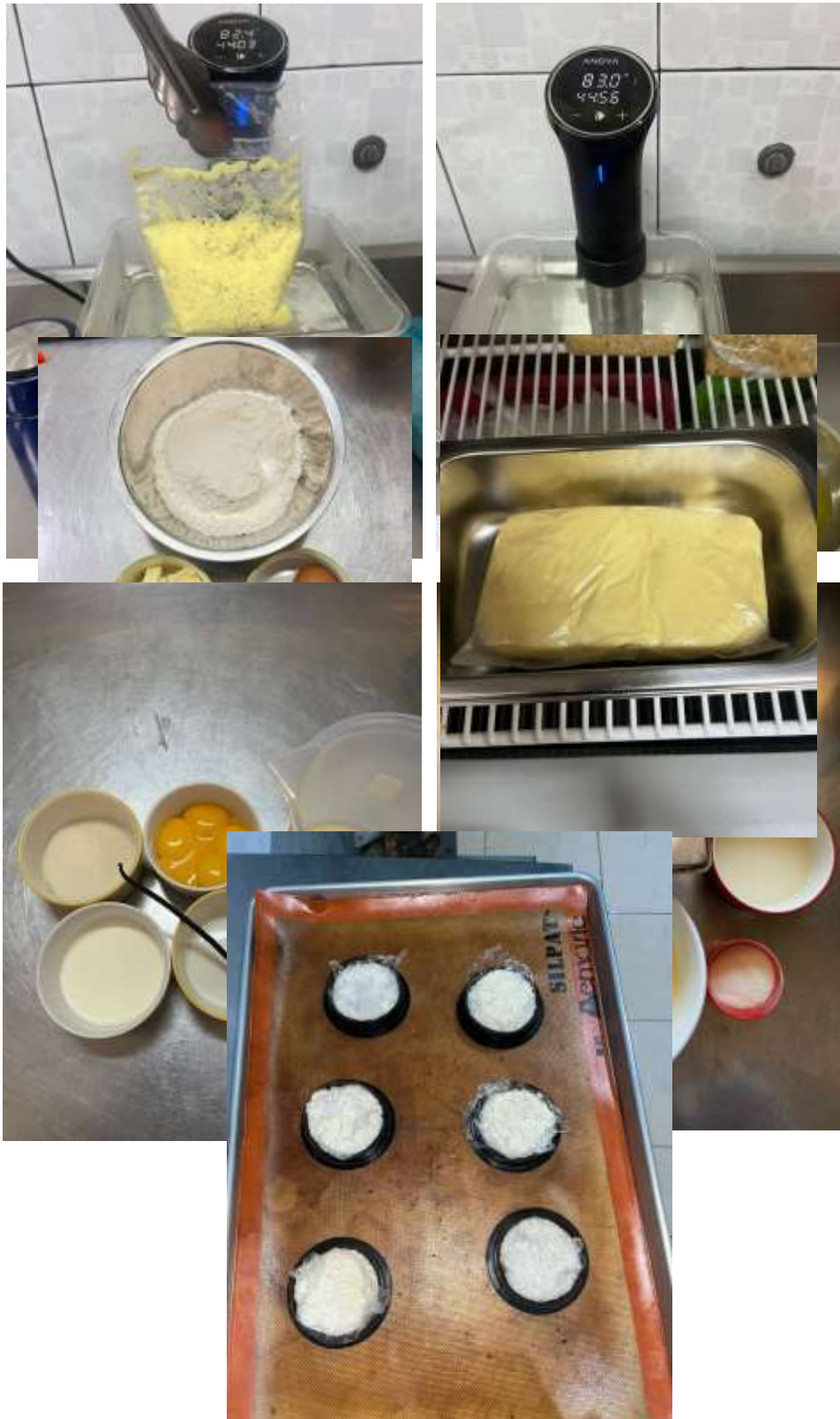
Lampiran 6. Hasil