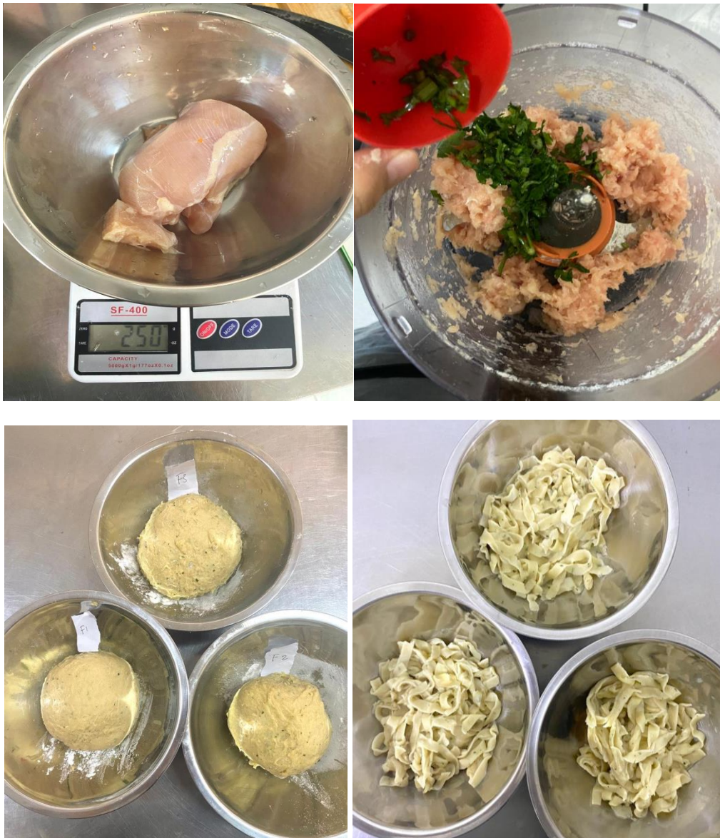
Lampiran 3. Proses Pembuatan