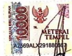
Rahmi Nuralya Azhari NIP 2133027